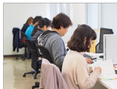
伝票入力センター