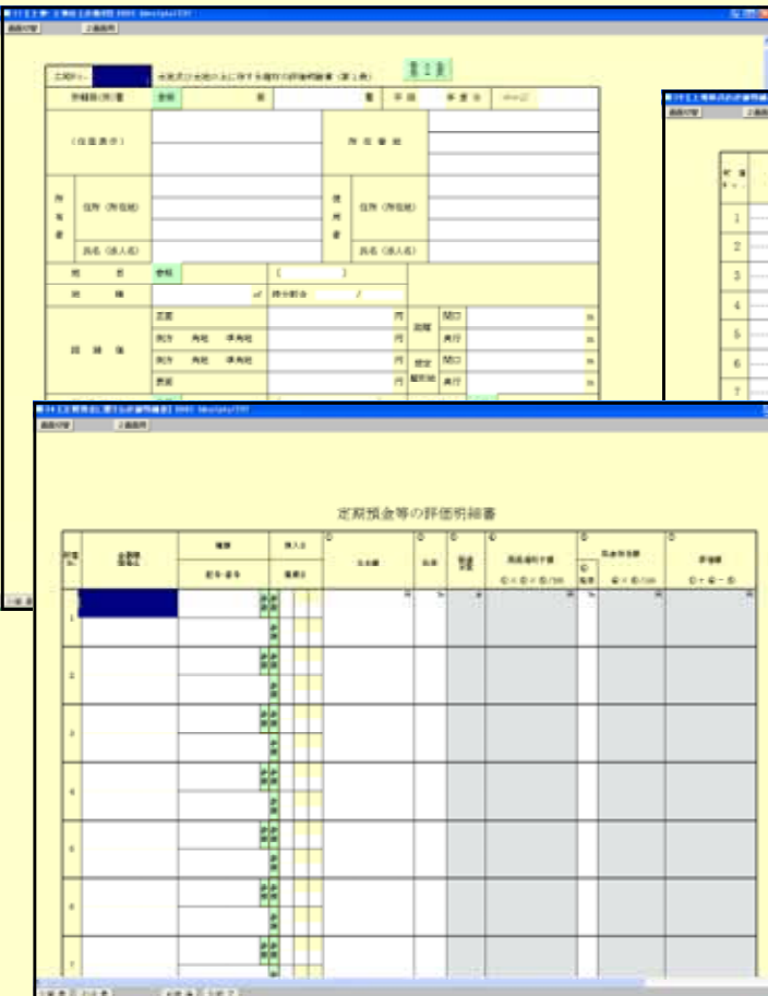
< 上場株式の評価明細書 >